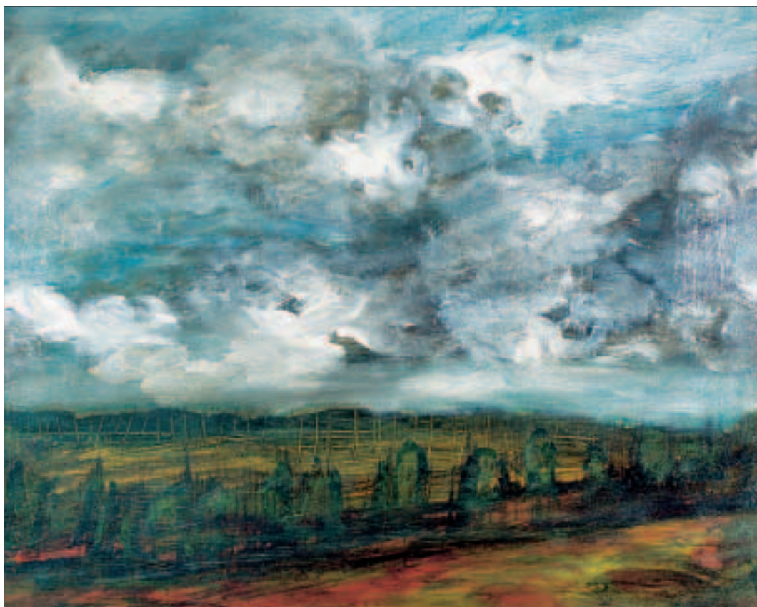
Bufera imminente - olio su cartone di cm 50x40 - 1995