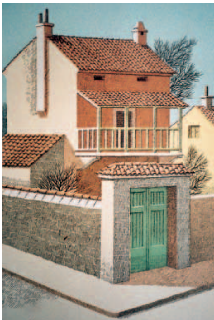
Motivo carsico - serigrafia di cm 46x62 - 1992

Vive e lavora a Trieste, in via Moreri 11, tel 040 421601.