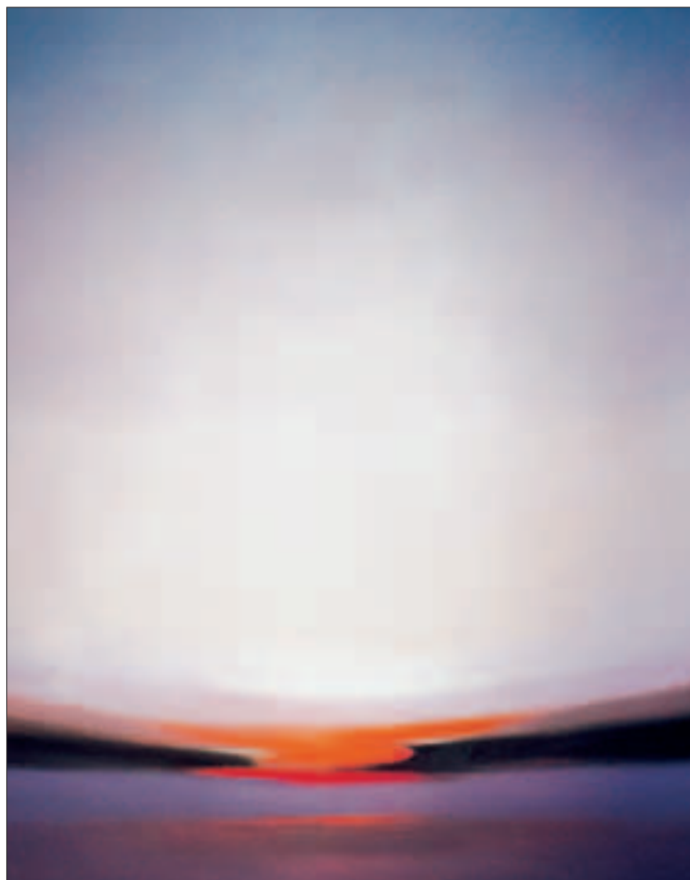
Tramonto - olio su tela di cm 50x70 - 2003