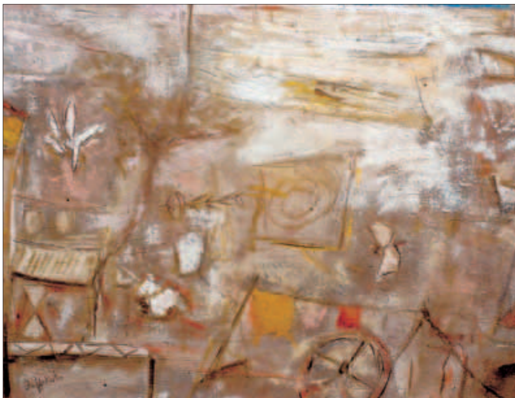
Spiaggia silente - tecnica mista su faesite - 52x42 - 1998