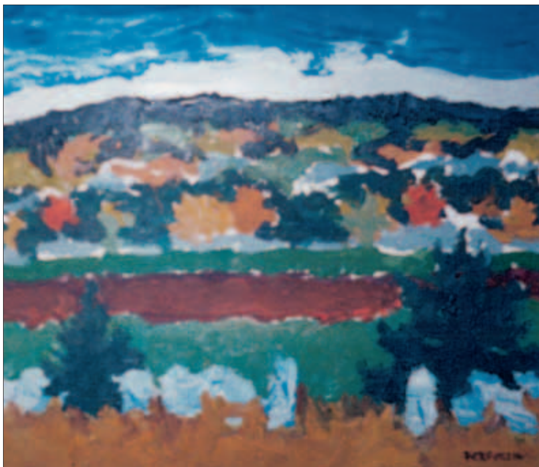
Paesaggio del Carso/Carso ventoso - olio su compensato di cm 32x28 - 1996

Vive e Lavora a Trieste in Via Scala Santa, 44/c, tel. 040/425208.