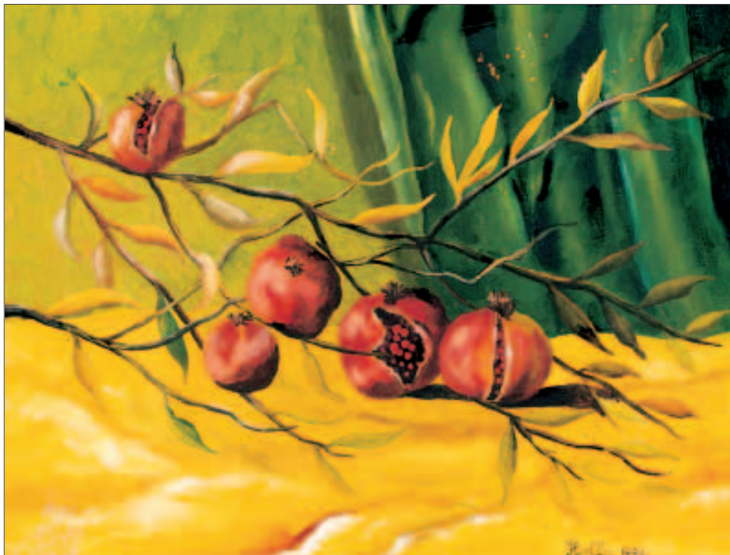
I melograni - olio di cm 55x45 - 1999

2. Girasoli e frutta - tecnica mista di cm 65x29 - 2003