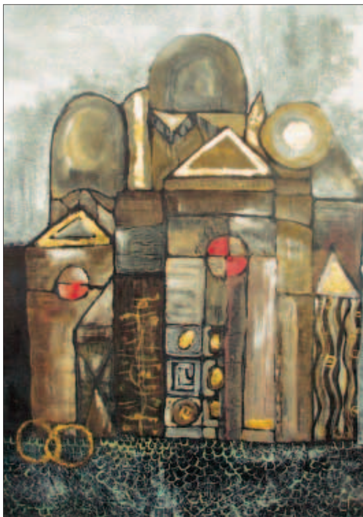
Chiesa ortodossa - collage di tecniche miste su cartoncino di cm 50 x 70 - 2000

Vive e lavora a Trieste in Vicolo Scaglioni 30, tel 040 942317.