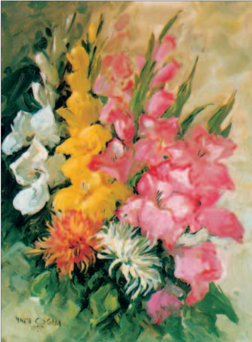
Gladioli e daliae - olio su tela di cm 35x45 - 1997