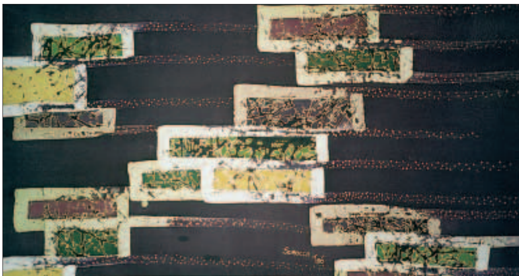
Scirocco - pittura su seta di cm 90x50 - 1997