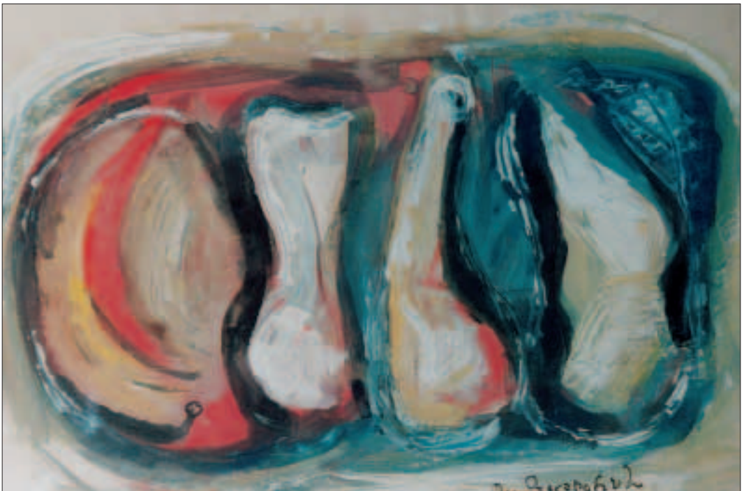
Brocche - guache su carta di cm 60x50 - seconda metà degli anni novanta