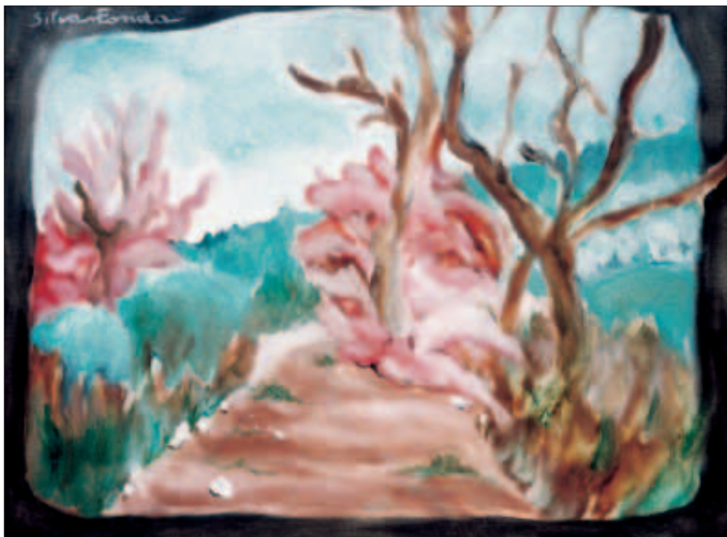
Carso, albero spoglio - olio su tela di cm 80x60 - 1997

Vive e lavora a Trieste in piazza Volontari Giuliani 6, tel. 040 572008.