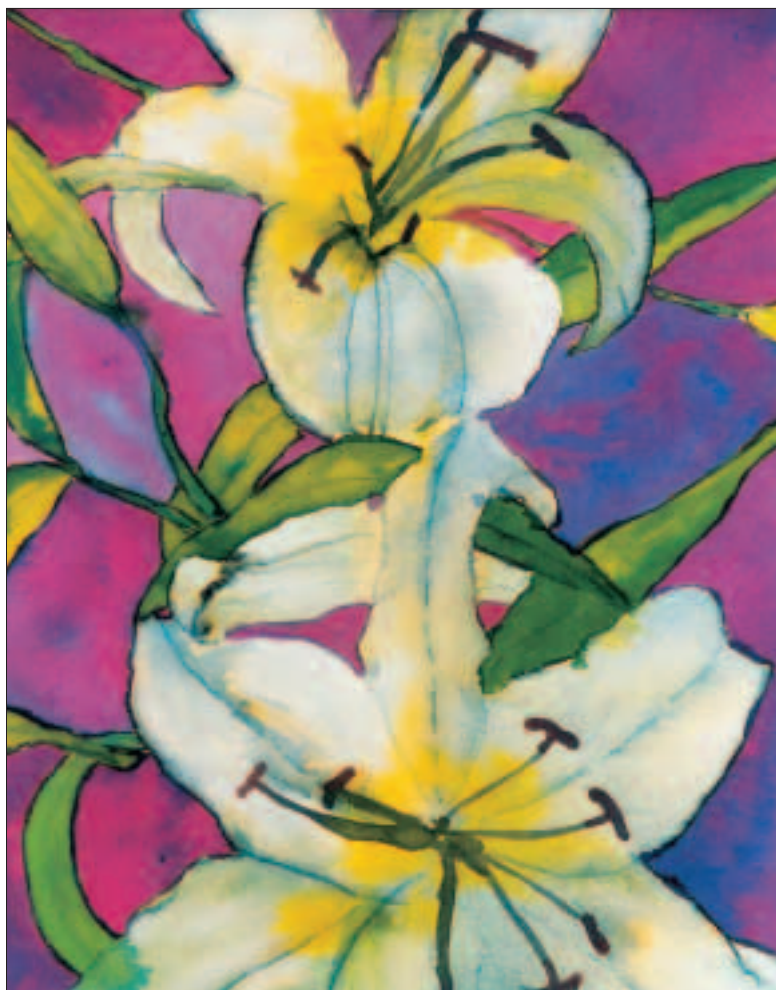
Giglio bianco su sfondo lilla - tecnica mista china e inchiostri colorati su carta di cm 25,5x31 - 2000