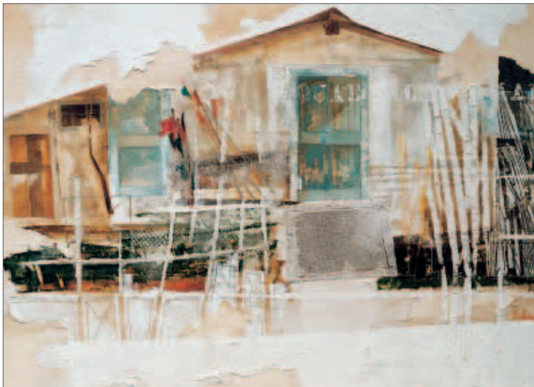
Le reti da pesca - tecnica mista su tela di cm 70x50 - 2000

Vive e lavora a Monfalcone in via Cima 13, tel. 0481 482354.