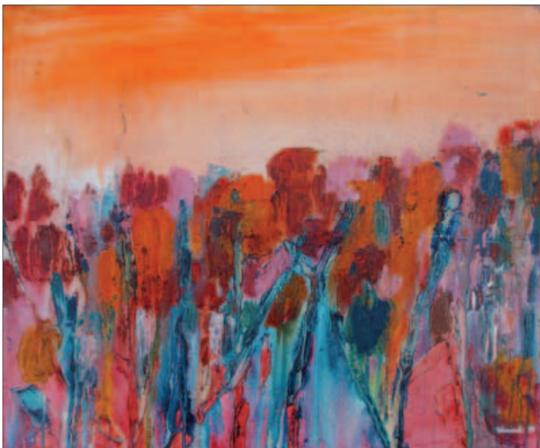
Campo di tulipani - acrilico su tela di cm 60x50 - 1999

Vive e lavora a Vienna in Hazingergasse 10, tel 00 43 1 4795652.