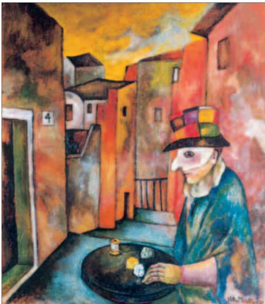
Il destino è nei dadi - olio su faesite di cm 70x70,8 - 1997

Nata a Trieste il 14 gennaio 1932, ha cominciato a dipingere sotto la guida del pittore triestino Carlo Pacifico. Dal 1955 si dedica alla linoleografia e dal 1972 al disegno a china. Come pittrice e grafica ha partecipato a 549 esposizioni e giovanissima fu presente, tra l'altro, alla Quadriennale di Roma e alle Trivenete di Padova. Ha allestito mostre personali in Italia e all'estero. Dal 1965 è socia dell'Associazione Incisori Veneti, con sede a Venezia ed è socio fondatore di Xylon Italiana, con sede a Genova. Con questi enti e singolarmente ha partecipato a numerosissime esposizioni di grafica in ogni parte del mondo. Le sue opere si trovano in numerosi e importanti musei e quelle presenti nella raccolta dell'Università di Pisa sono state oggetto di una tesi di laurea. La sua maniera artistica, che si esprime sia nella pittura che nell'incisione, si esplica in modalità tra il metafisico e l'espressionista. Si tratta della figura umana sottoposta a drammatici condizionamenti, inserita in un ambiente di vuoti silenzi caratterizzati dal colore corrusco in pittura e dal chiaroscuro deciso nell'incisione. Vive e lavora a Trieste in via Parini 17, tel. 040 636773.