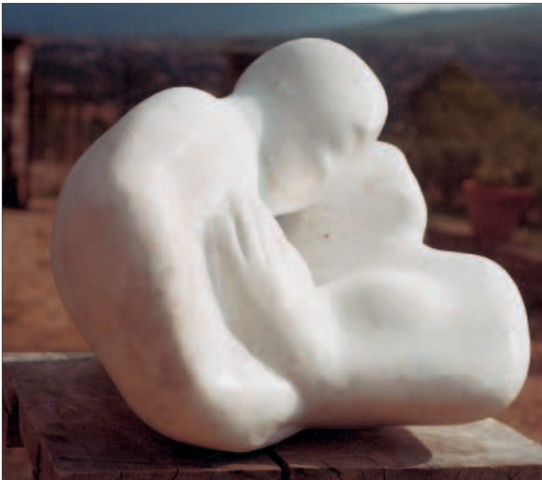
Amanti - marmo bianco antico alt. cm. 30 – largh. cm. 30 – prof. cm. 50 – base di legno cm. 5 - 1992

Amanti - marmo bianco antico alt. cm. 30 - largh. cm. 30 - prof. cm. 50 - base di legno cm. 5 - 1992