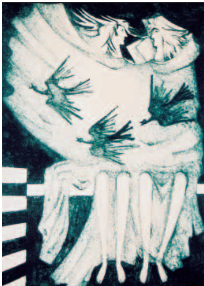
Le amiche - punta secca di cm 35x50 - 1989