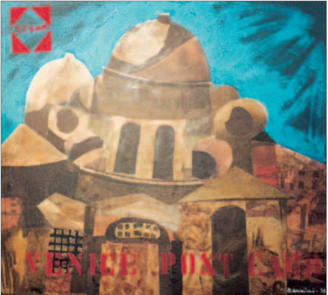
Omaggio a B. Longhena (dal ciclo Post Card) - tempera e collage su tela di cm 60x60 - 1998