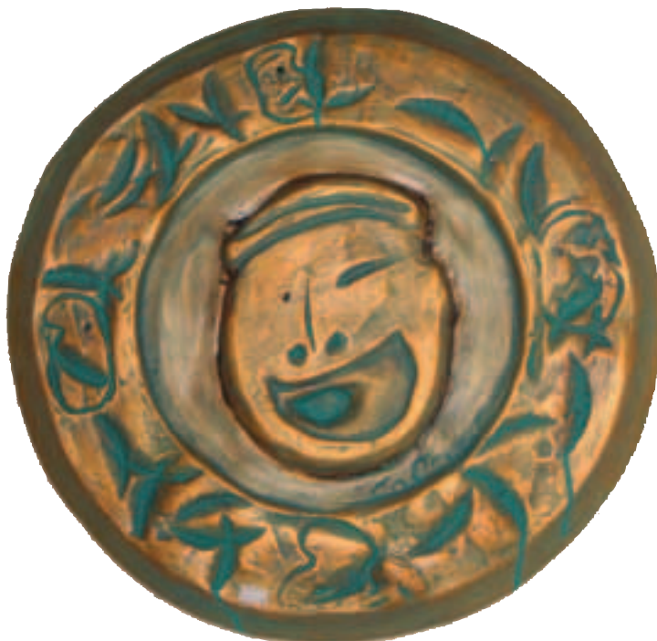
Sorriso - ceramica laccata tipo bronzo di diametro cm 40 - 1990