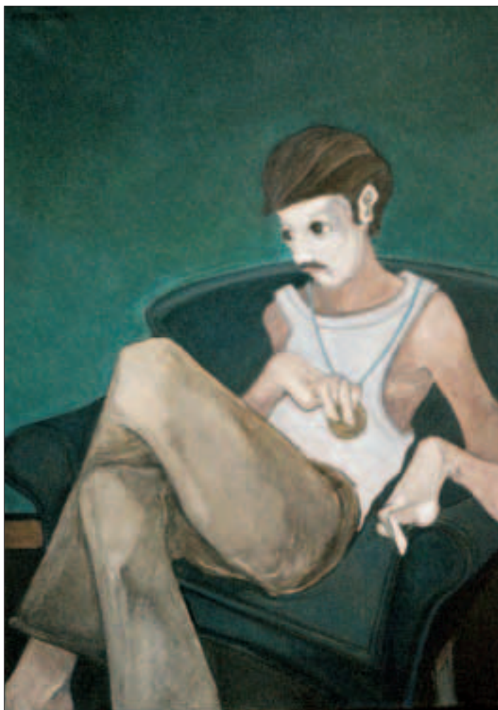
La medaglia - olio su tela di cm 50x70 - 2001