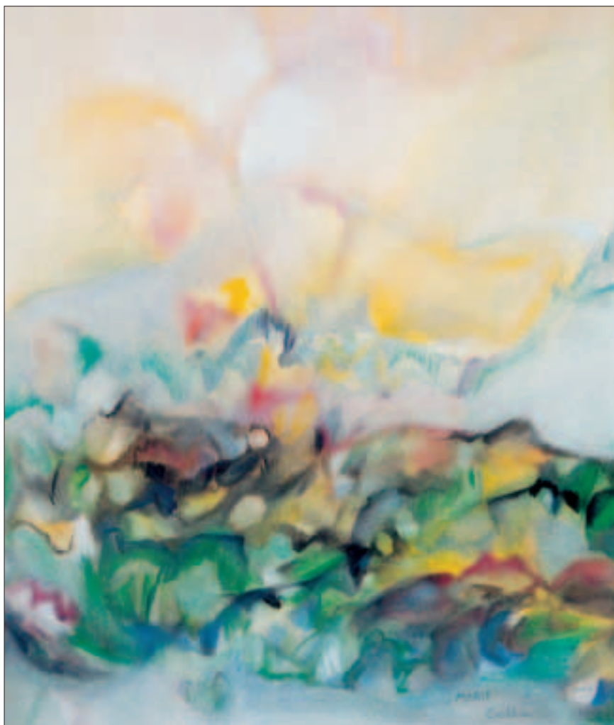
L'alba - olio su tela - 50x60 cm - 2002

Vive e lavora a Trieste in via Tasso 3, tel. 040 425122, con studio in via Udine 35.