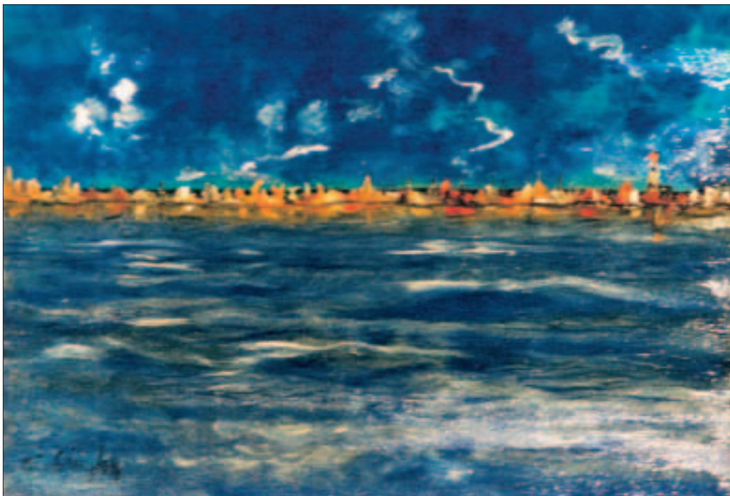
Bufera - olio su tela di cm 50x35 - 1999

2. Campagna mediterranea - olio su tela di cm 60x30 - 1999