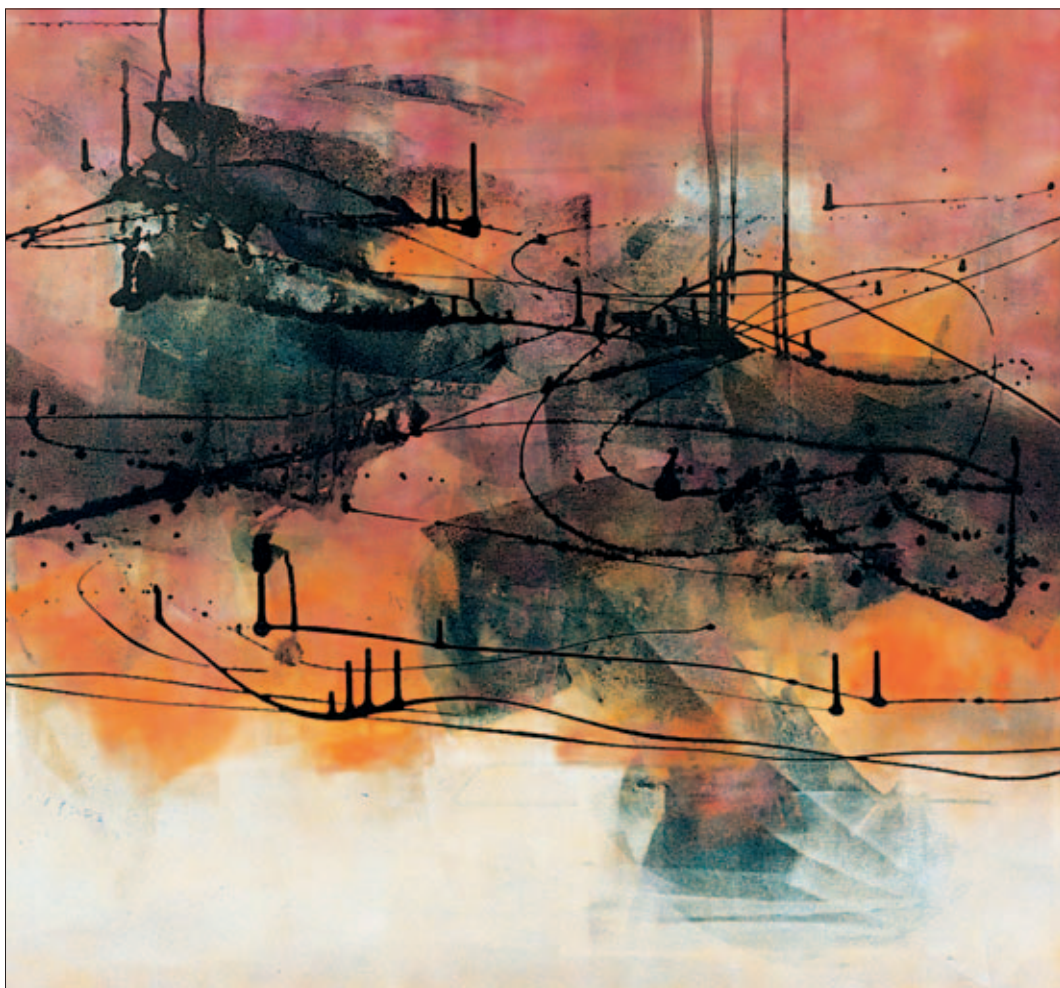
SGUARDO SUL MOLO – Tecnica mista su tela di cm 80x90 – 2002