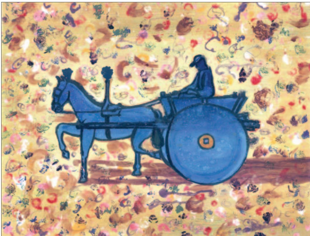
Carretto e carrettiere- olio su carta di cm. 40x45 1990

Le maschere sono eseguite con ferro filato, cartone, tela, colla, cartapesta, gesso e similoro a foglie.