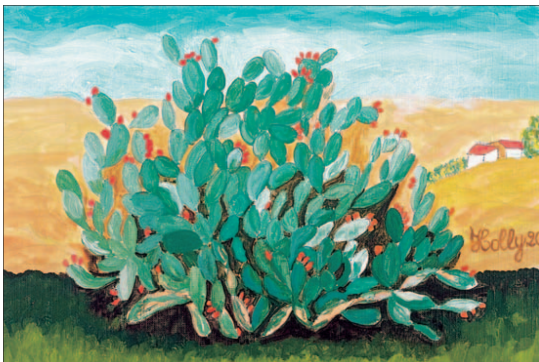
Fichi d'India – acrilico su tela di cm. 30x20 – 2002