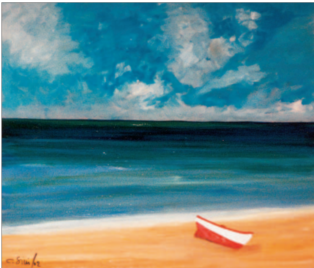
Barca sulla spiaggia – Olio su tela di cm 60x70 – 2002