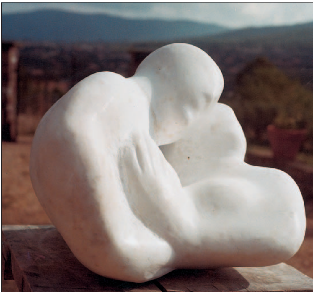
Amanti– marmo bianco – alt. cm. 30 – largh. cm. 35 – prof. cm. 33 – base di legno cm. 4 - 1992