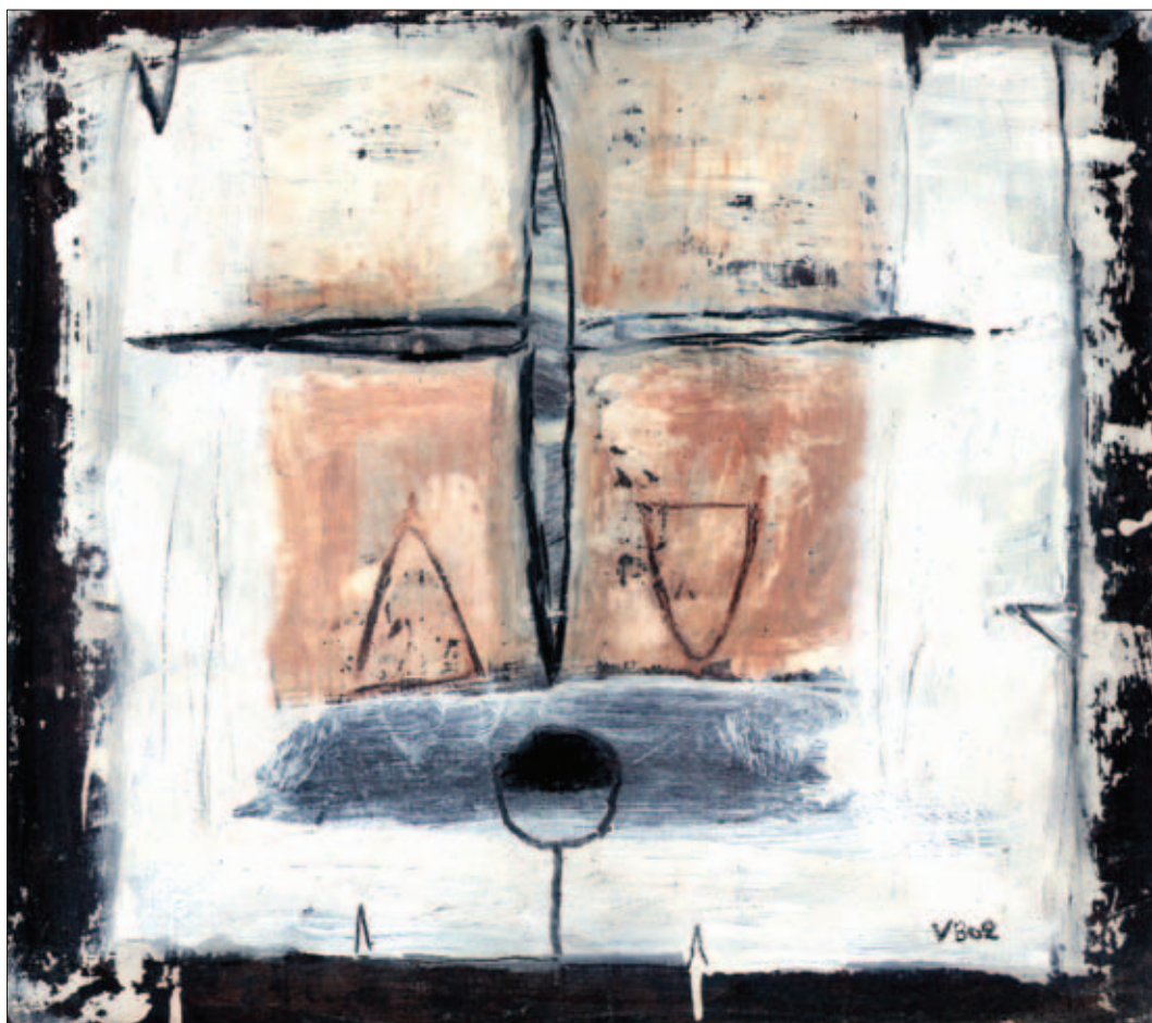
Principio intorno alla creazione - Tecnica mista su tela di cm 44x38 – 2002