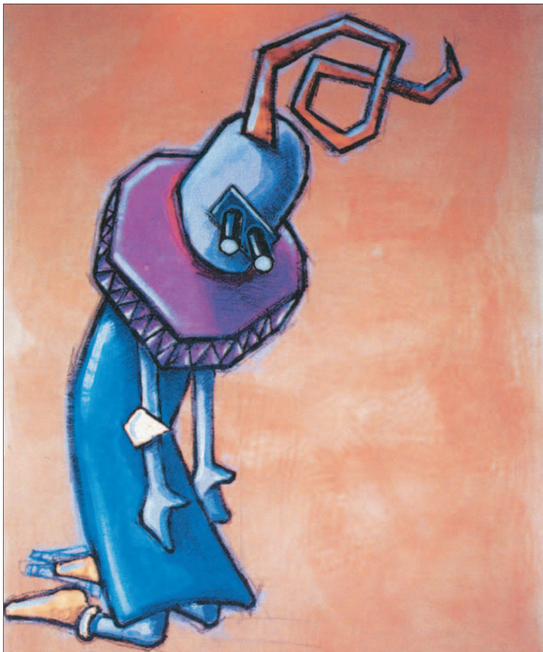
Cuore – Acrilico su carta da scenografia di cm 100x150