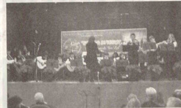
Un momento del concerto